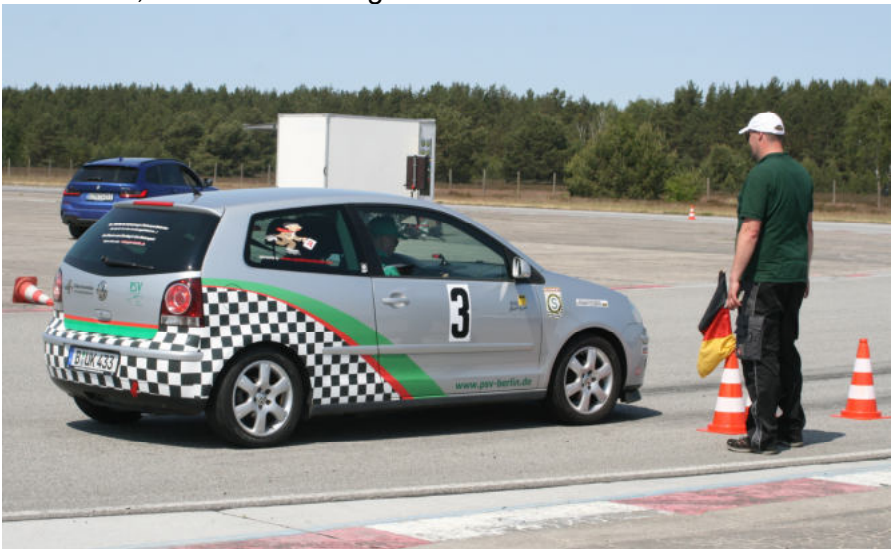
Der Vereins-Polo bei den Dölln 5000

Als nächstes folgen die Clubslaloms und das PSV-Turnier am 2. Juli. Für das Turnier haben schon vier Fahrer auf den Polo genannt. Mal sehen, wie er sich schlägt.