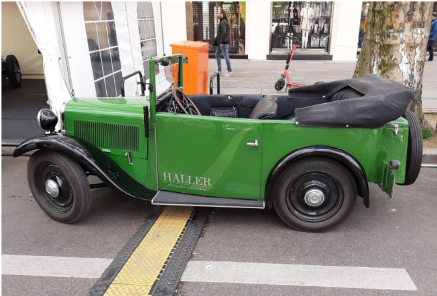
2 BMW in PSV-Grün

im Flug, bis die Rückfahrt mit vielen schönen Eindrücken angetreten wurde.